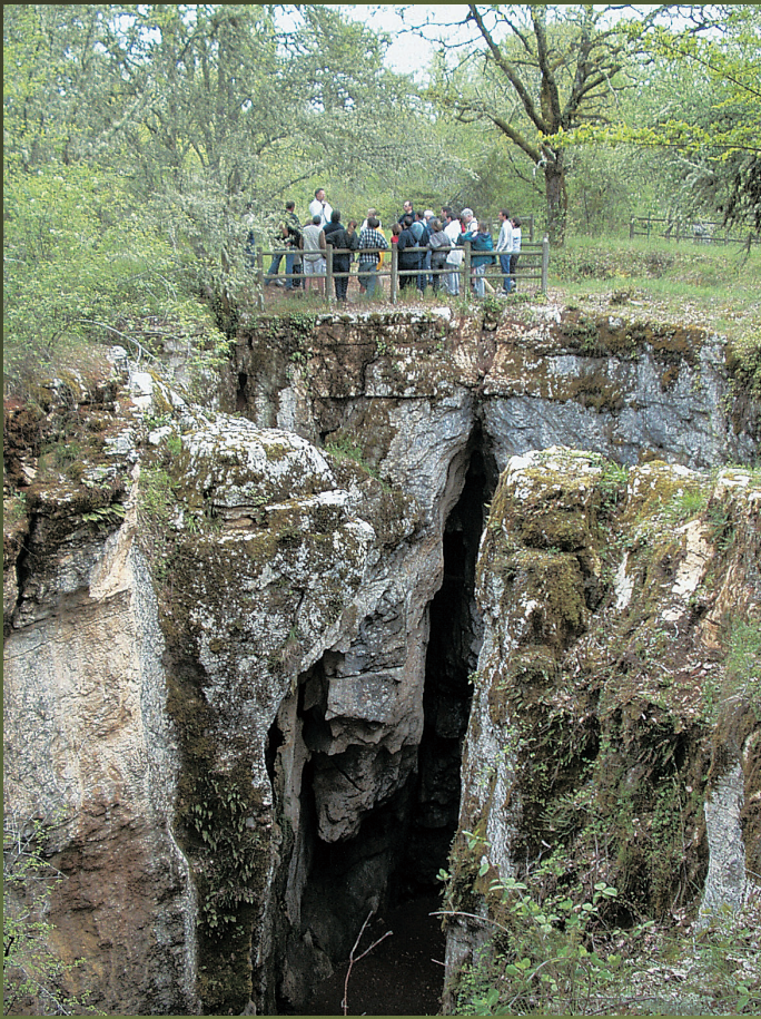
Les phosphatières du Cloup d'Aural