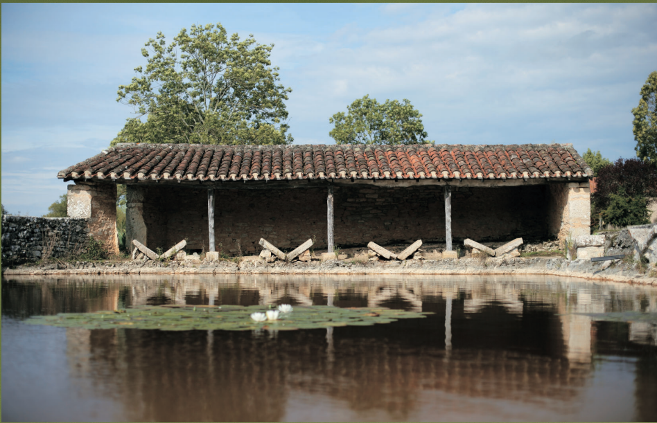
Lavoir de l'Escabasse