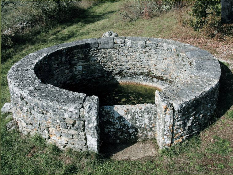
Puits du 18 e siècle