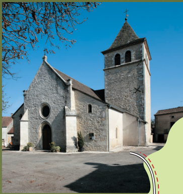
Eglise Notre Dame de l'Assomption